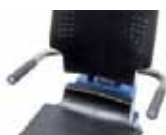
Accoudoirs élargis Ecartement de 54 cm (standard 44 cm), Art. n°945 146