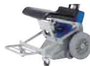
Repose-pieds repliable Art. n°945 157