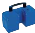
Batterie encliquetable BU-PT 5,2 Ah, poids 4,3 kg, capacité 5,2 Ah, tension 24 VDC Art. n°004 150