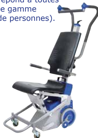
PT S modèle de base

Pendant la descente, et à la différence des autres monte-escaliers, le LIFTKAR PT reste immobile tant que les roues d'arrêt n'ont pas atteint la marche inférieure. Cela procure à l'accompagnateur et au passager une plus grande sensation de sécurité dans les escaliers.