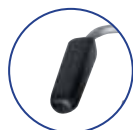
Accoudoir rembourré Art. n°945 148