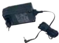
Chargeur secteur BC-PT (Fiche CE) Art. n°045 141

Accessoires d'origine pour les monte-escaliers LIFTKAR PT (inclus dans le matériel standard):