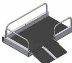
Accès latéral bas