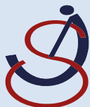
TABLE D'ACCUEIL UNIVERSELLE POUR P.M.R.

Correction de posture pour tous types de tables